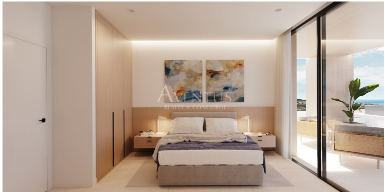
APARTAMENTO EN SAN PEDRO DE ALCANTARA